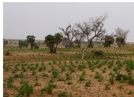
champs de mil en zone agricole

D'autre part, l'originalité du Code Rural est qu'il s'insère pleinement dans les stratégies politiques globales du pays. La politique foncière et agricole n'est pas cloisonnée, mais bien intégrée aux politiques économiques de développement qu'essaie de promouvoir le Niger. Ainsi, les principes directeurs d'une Politique de Développement Rural pour le Niger, adoptés en 1992, proposent 5 axes stratégiques qui mettent en valeur les objectifs annoncés du Code Rural : gestion intégrée des ressources naturelles, organisation du monde rural, sécurité alimentaire, intensification et diversification des productions, financement du monde rural. De même, le Programme de Relance Économique de 1997 affirme que le secteur rural doit servir de moteur à l'économie nationale et fait directement référence aux principes d'orientation du Code Rural. Enfin, la loi cadre sur la gestion de l'environnement de 1998 insiste sur l'importance de la sécurisation foncière et de l'aménagement du territoire.