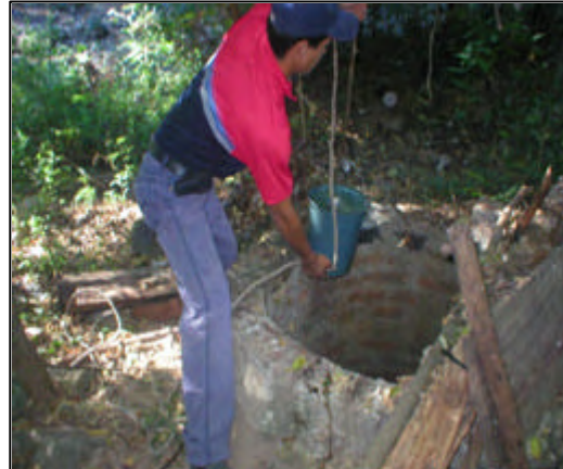
Sacando agua considerable del pozo.