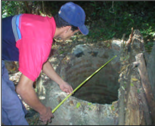
Midiendo el diámetro del pozo.

Trabajo en terrenos para determinar tipo de suelo y aforación de fuente de agua. Los técnicos de CODER junto con los dueños de terreno donde hay fuentes de agua (a los cuales se les explica el procedimiento), van al terreno a medir el potencial de la fuente de agua y acceso a la misma, a la vez que se realiza el estudio de suelo del terreno. Para ver el procedimiento de aforación dirigirse a anexo A: Procedimiento para aforación de fuentes de agua.