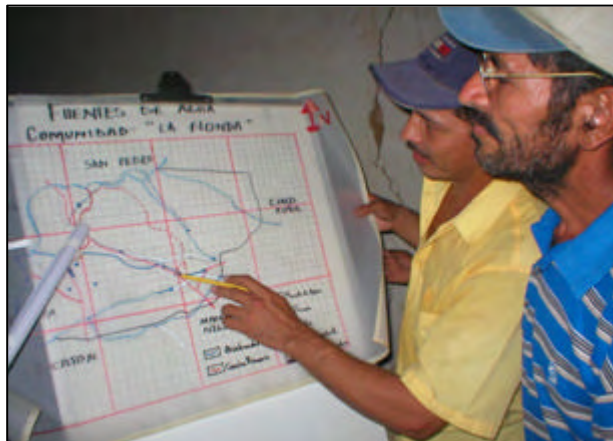
Pobladores de la comunidad La Honda identificando las fuentes de agua de su comunidad.